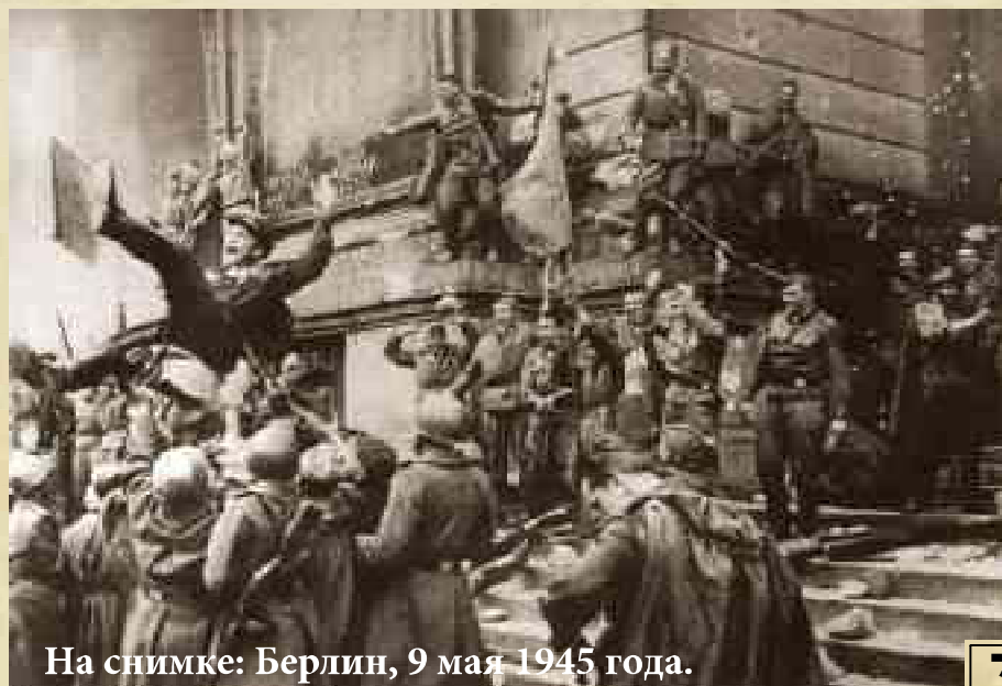
На снимке: Берлин, 9 мая 1945 года.