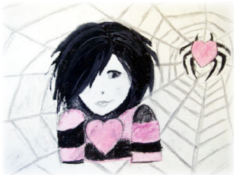
Художник Полина Шуст