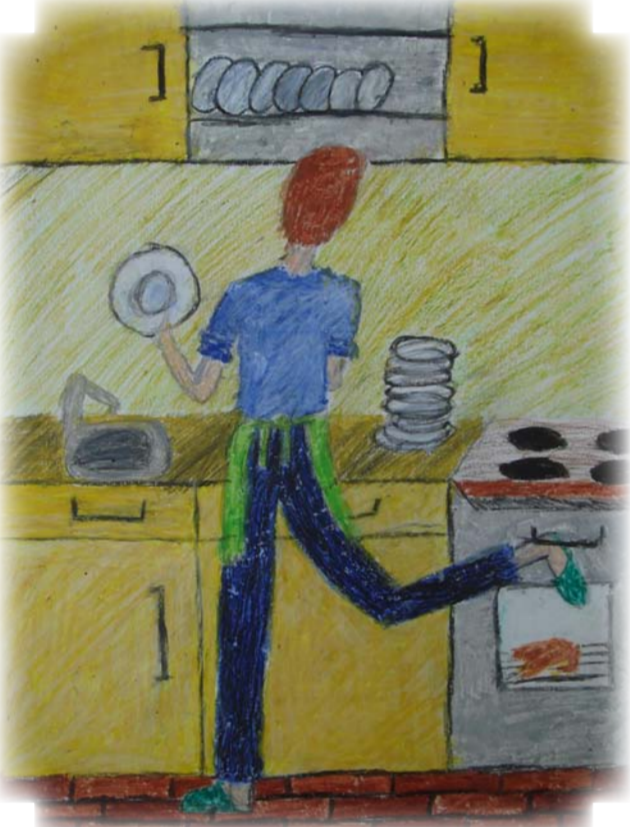
Художник Полина Шуст