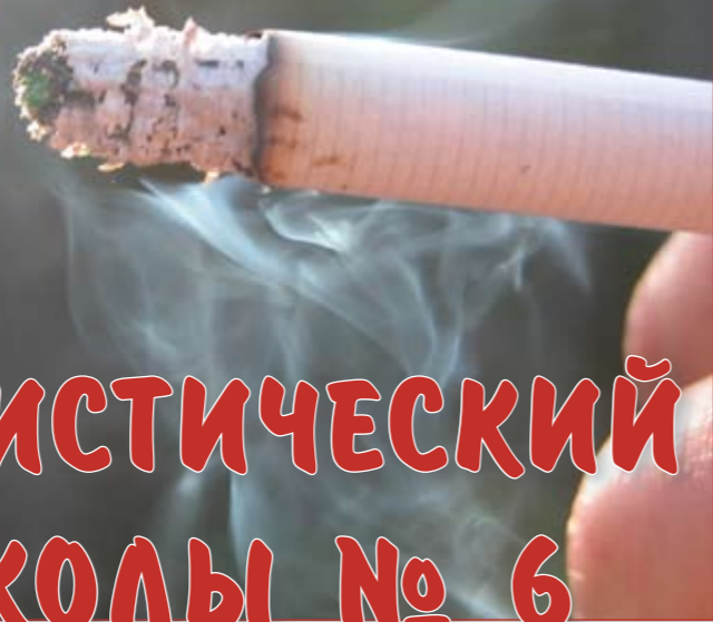
Возрастной состав курильщиков школы (в % от числа всех учащихся)

На сегодняшний день 25% курильщиков нашей школы находятся на стадии зависимости, т.е. без посторонней помощи отказаться от пагубной привычки уже не смогут. Но на вопрос «Смогли бы вы отказаться от курения?» - все ребята ответили утвердительно!